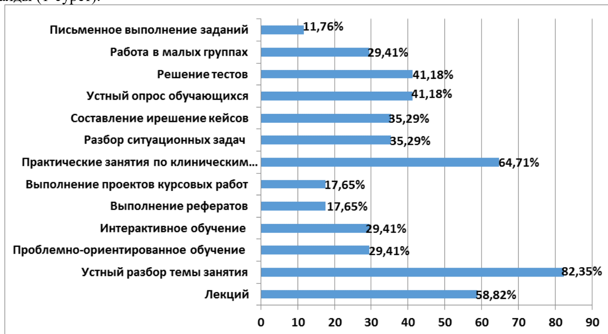
Сурет 1. Пайдаланылған тыңдаушыларды оқыту әдістеріне қатысты оқытушылар сауалнамасының нәтижелері.

Тыңдаушыларды оқыту процесіне келетін болсақ, оқытудың ең танымал әдістері анықталды (1-сурет).